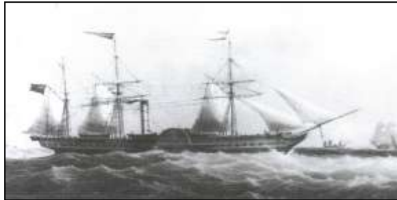
Acadia, Cunard Line. 1.154 tonn.

I året 1840 stiftet Samuel Cunard sitt legendariske skipskompani, The British & North American Royal Mail Steam Packet Company, populært kalt The Cunard Line. Han bygde umiddelbart fire store og raske fartøy, Acadia , Britannia , Columbia och Caledonia som gjennomførte en reise over Atlanteren på 14 dager.